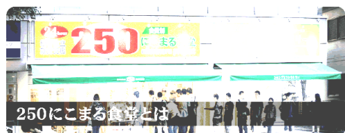
K2 インターナショナル 250 食堂