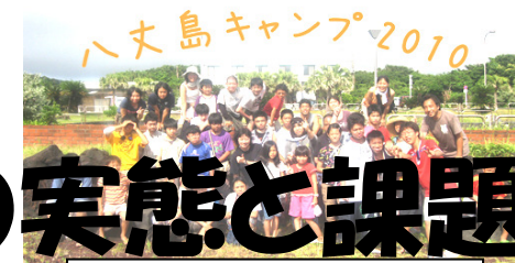
フリースペースたまりば